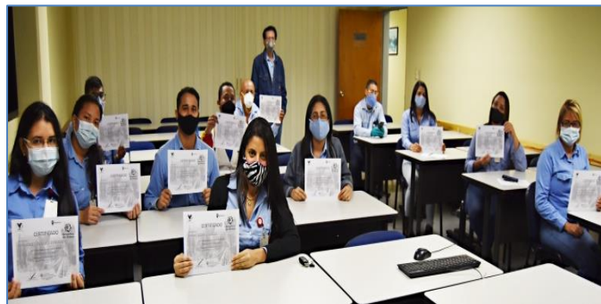
Figura 3: cursos virtuales activando el perfil auditivo, visual y kinestésico

Como un ensayo en un servidor en la red administrativa (OrinocoNet) de múltiple acceso, se ubicaron videos de un curso de Excel 2010, de acceso libre (gratis), descargado previamente desde YouTube, se desarrollaron tres niveles de Excel y un nivel de Estadística Básica. La metodología consistió en asignar algunas tareas a los participantes; se generó un compromiso entre los participantes y el facilitador, el cual se cumplió, los participantes envían sus tareas vía correo; hasta la fecha van 85 participantes aprobados. En el desarrollo de las tareas se aplicaron los tres perfiles de aprendizaje, las tareas consistieron en ver y oír los videos, luego los participantes debían hacer las tareas asignadas. En la figura 3 se muestra la entrega de certificados.