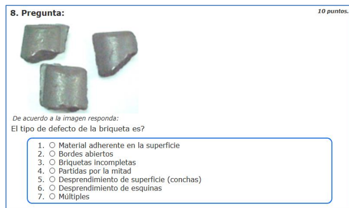
Figura 1: cuestionario activando el perfil visual y kinestésico.

Certificación: todos los cursos poseen una única evaluación, la cual es creada a través de la plataforma por el facilitador. Por ejemplo el caso de selección simple en la figura 1.